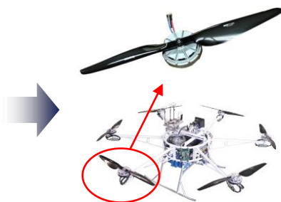
開発モータ搭載のドローン例 （株式会社石川エナジーリサーチ製 ハイブリッドドローン）